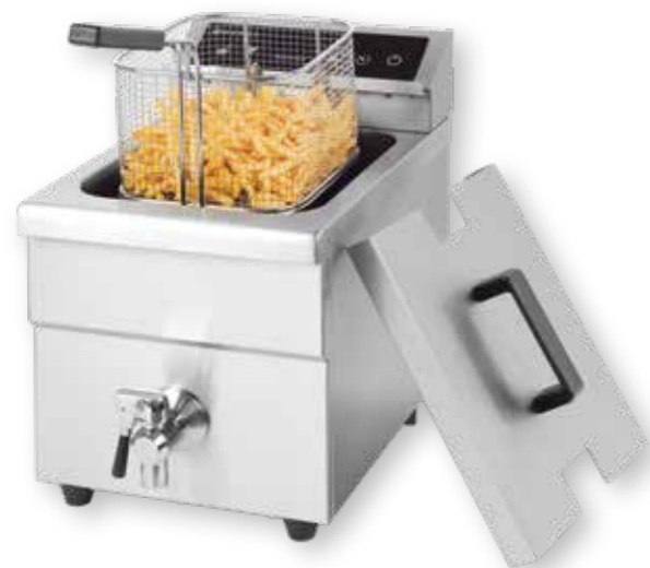
98 INDUKČNÍ FRITÉZA KITCHEN LINE 8 LITRŮ 215012

přesná kontrola teploty, indukční technologie udržuje olej v přesně nastavené teplotě, dva časové odpočty, tělo z nerezové oceli pro snadné čištění 1300 bodů