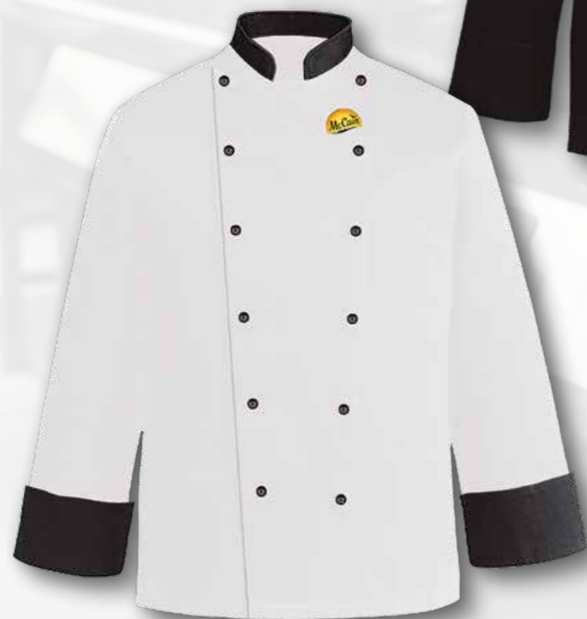
54 BÍLÝ RONDON S ČERNÝMI LEMY KOLEM KRKU A NA RUKÁVECH 55 bodů

dámský i pánský rondon, bavlna/polyester 195g, včetně loga McCain