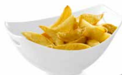
14 PORCELÁNOVÁ MISKA 785690 140 x 102 x 65 mm 5 bodů