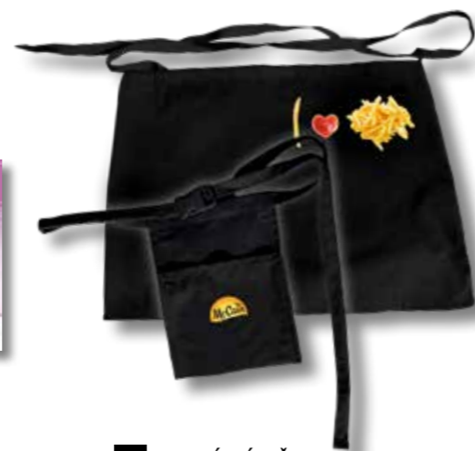
131 VESELÁ ZÁSTĚRA S HRANOLKAMI 40 bodů s kapsářem na peněženku