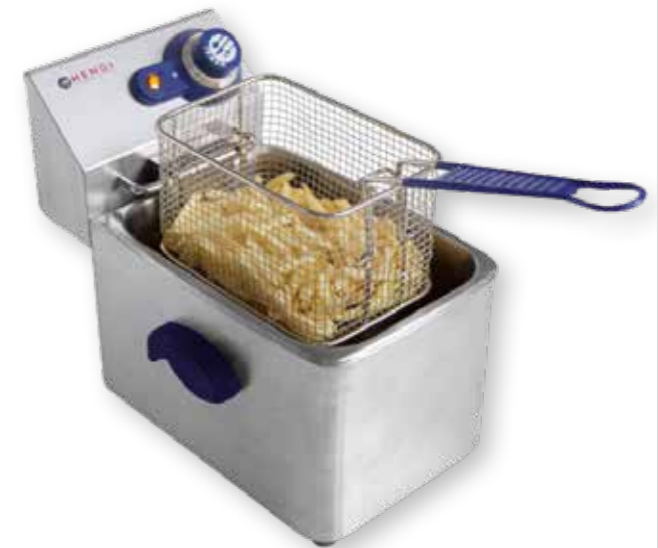
95 FRITÉZA BLUE LINE 4 LITRY 205808 nastavení teploty až do 190 °C, bezpečnostní termostat, tělo a olejová nádrž z nerezové oceli, nastavení teploty až do 190 °C 200 bodů