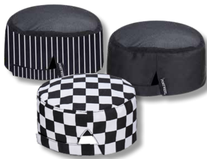
KUCHARSKÉ ČEPICE každá 15 BODŮ