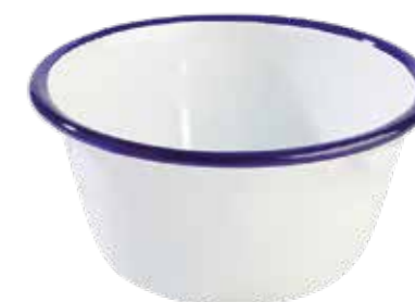
19 SMALTOVANÁ SERVOVACÍ MISKA 15 bodů na smažená jídla i polévky, 500 ml, 13 x 6 cm