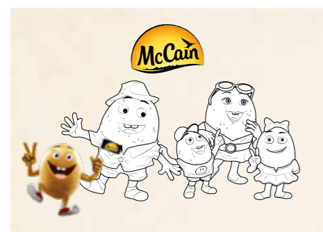
129 PROSTÍRÁNÍ OMALOVÁNKY 10 bodů 50 kusů v balení, rozměr A3