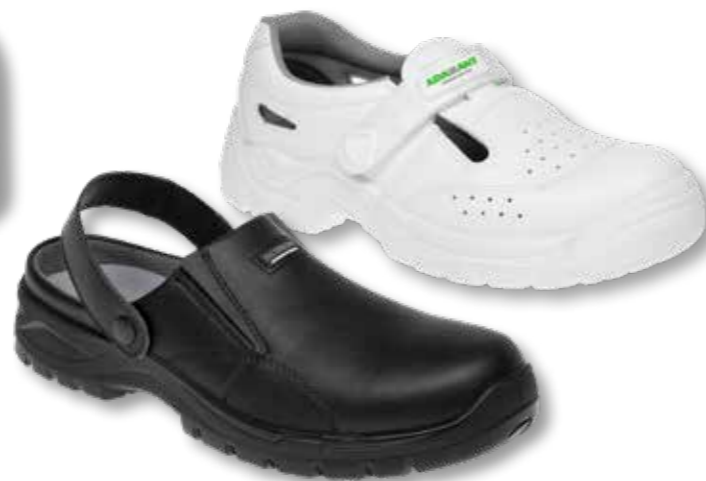
86 ČERNÉ SANDÁLY 75 BODŮ

pratelný model na 30°C, podrážka odolná proti uklouznutí, energie absorbována v patě