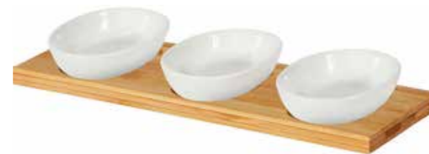
34 SERVOVACI STOJAN NA DIPY SE TREMI MISKAMI na bambusovém tácku, rozměry setu: 28 x 2,5 x 1 cm, 15 bodů