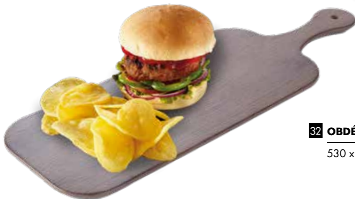
32 OBDELNIKOVY TAC V IMITACI DREVA S UCHYTEM 561317 530 x 200 mm 45 bodů