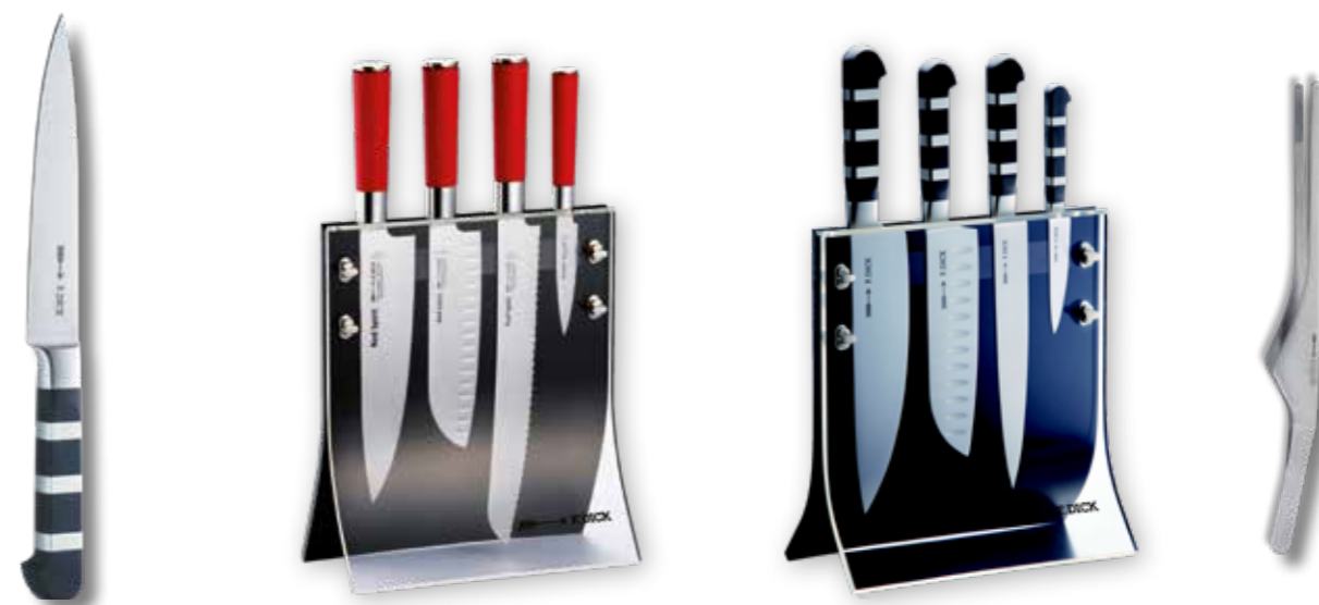
104 DRANŽÍROVACÍ NŮŽ