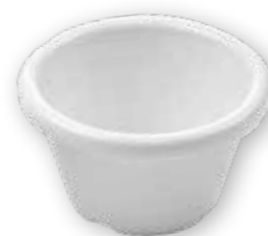
37 MISKA NA OMACKU 565612 bílá, 45 ml, 6 x 6 cm, 15 bodů 12 kusů