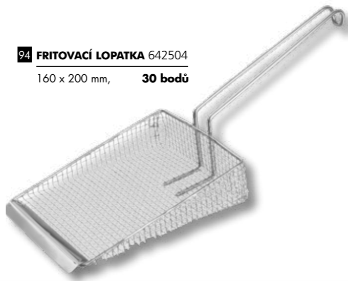
94 FRITOVACÍ LOPATKA 642504 160 x 200 mm, 30 bodů