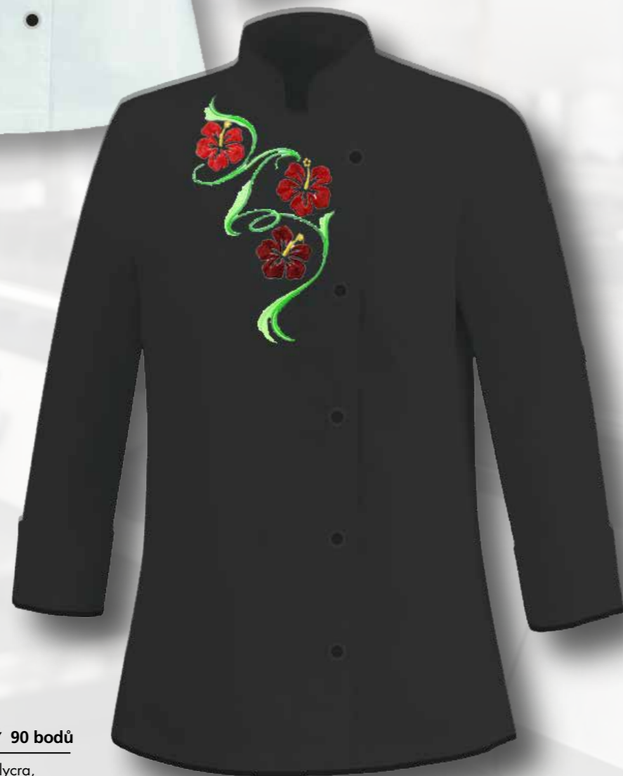
41 RONDON S VÝŠIVKOU KVĚTINY ČERNÝ 90 bodů

dámský pracovní rondon, bavlna/polyester/lycra, 205g