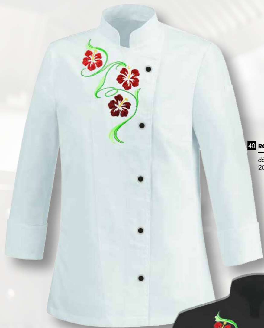
40 RONDON S VÝŠIVKOU KVĚTINY BÍLÝ 90 bodů

dámský pracovní rondon, bavlna/polyester/lycra, 205g