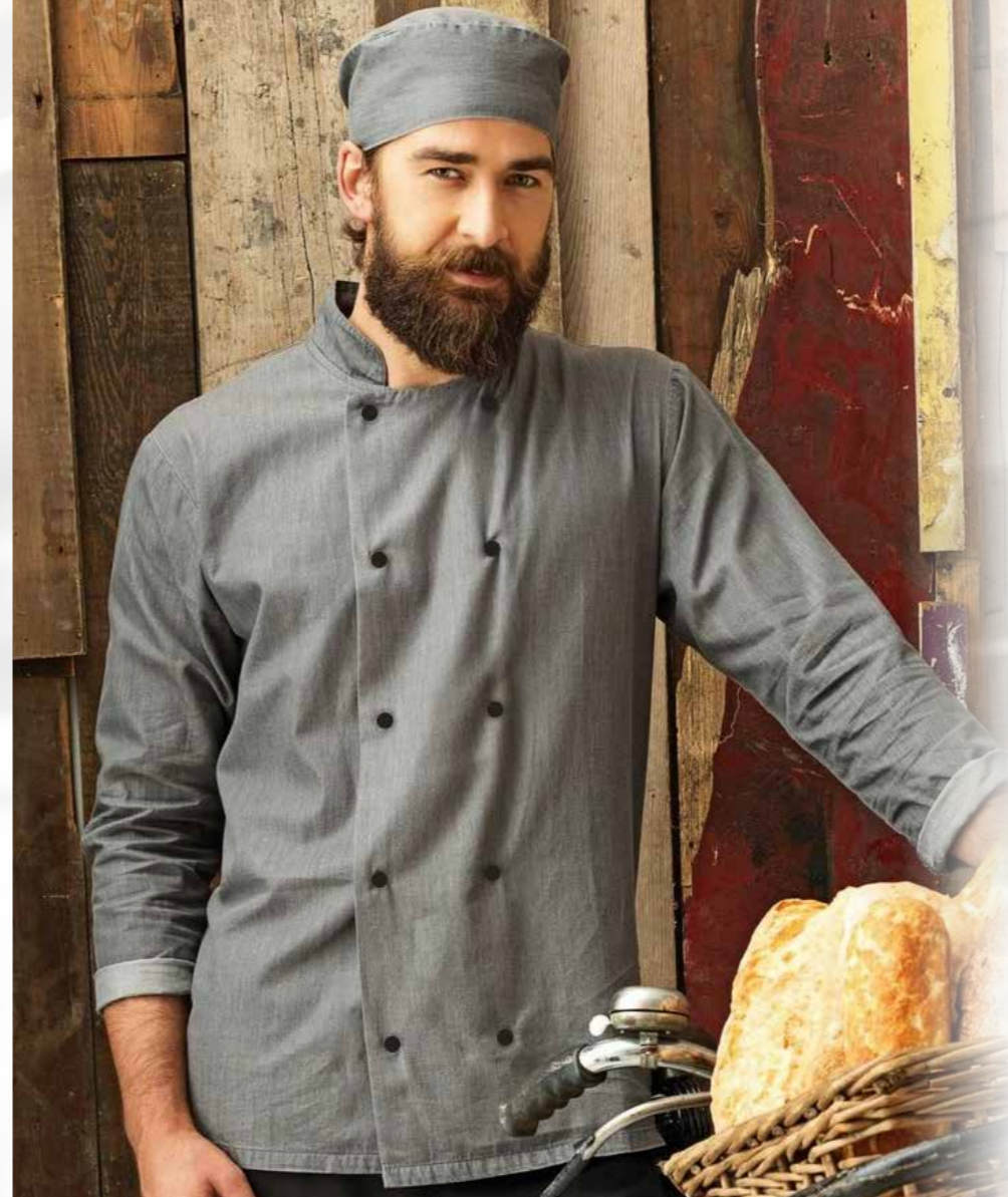
42 KUCHARSKÁ ČEPICE PŘÍRODNÍ 25 bodů

dámský pracovní rondon, bavlna/polyester/lycra, 205g