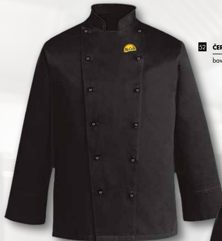
52 ČERNÝ RONDON DLOUHÝ RUKÁV 50 bodů