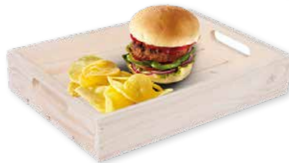
35 DREVENÁ BEDYNKA NA SERVOVANI 32 x 22 x 6 cm 20 bodů