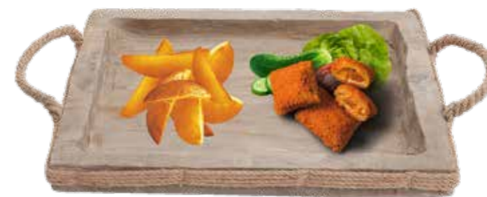
36 DREVENY SERVOVACI PODNOS 41 x 22 x 5 cm 50 bodů