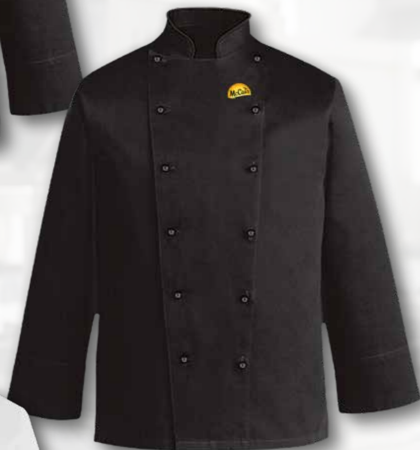
53 ČERNÝ RONDON ODLEHČENÝ DLOUHÝ RUKÁV 50 bodů