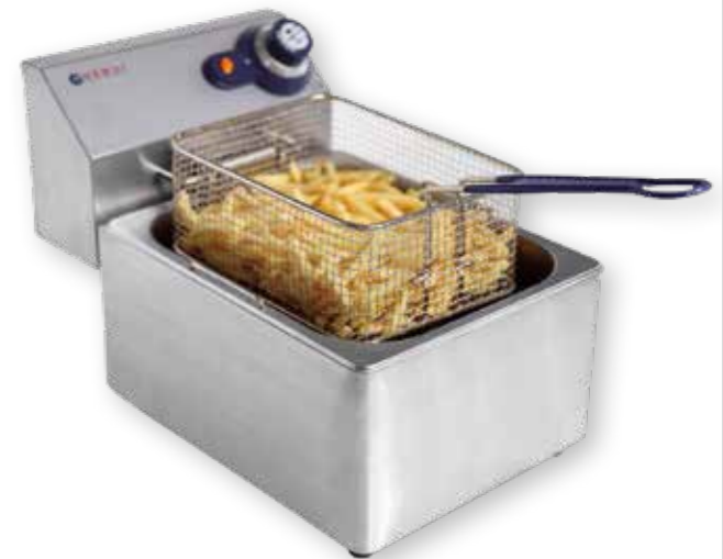
96 FRITÉZA BLUE LINE 6 LITRŮ 205815 tělo a olejová nádrž z nerezové oceli, nastavení teploty až do 190 °C, bezpečnostní termostat, vyjímatelný element s funkcí vypnutí po vyjmutí z fritézy 250 bodů