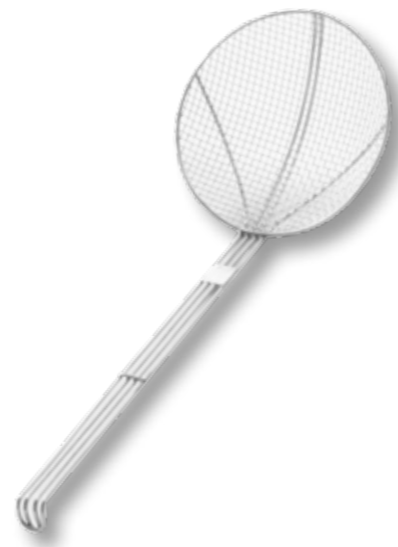
92 FRITOVACÍ LŽÍCE 640609 nerezavějící ocel se zesílenou drátěnou rukojetí, průměr 200 x 510 mm, 20 bodů