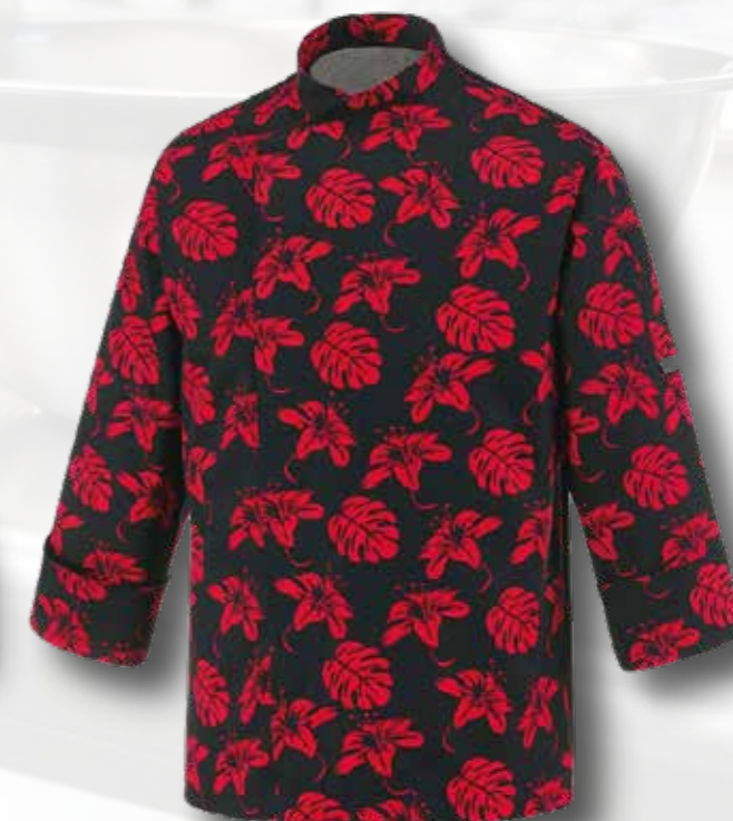
45 RONDON KVĚTY IBIŠEK 140 bodů

vyrobena v Itálii, manžeta na rukávu, bavlna 200g