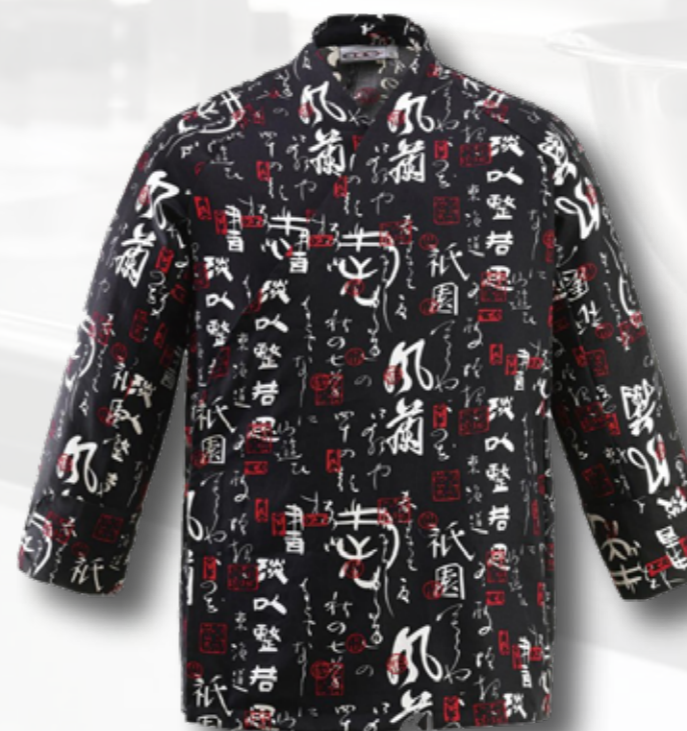
44 RONDON S ASIJSKÝM VZOREM 140 bodů

pracovní rondon v přírodní barvě, materiál len, šedé knoflíky