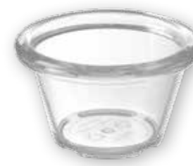
38 MISKA NA OMACKU 565629 čirá, 45 ml, 6 x 6 cm, 15 bodů 12 kusů