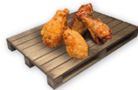
33 PALETA NA SERVOVANI 30 bodů vyrobená z březového dřeva, odolná proti vodě, lehce omyvatelná, 30 x 20 x 3 cm