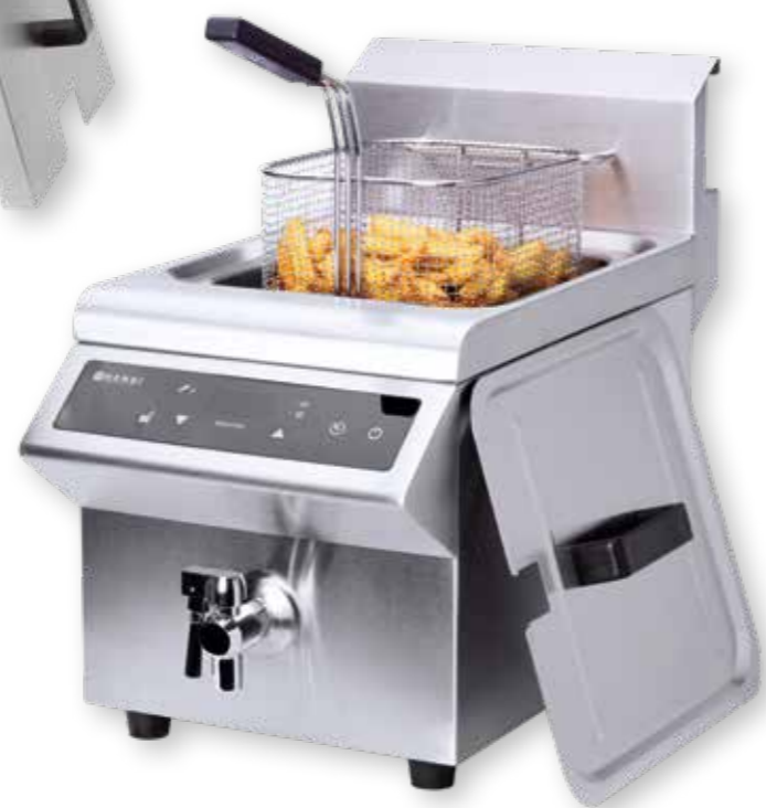
99 INDUKČNÍ FRITÉZA PROFI LINE 8 LITRŮ S DISPLEJEM 215005

přesná kontrola teploty, indukční technologie udržuje olej v přesně nastavené teplotě, nerez 570 bodů