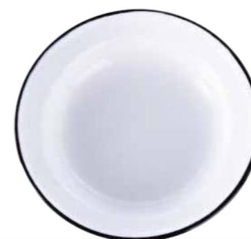
21 HLUBOKÝ SMALTOVANÝ TALÍŘ průměr 22 cm 10 bodů