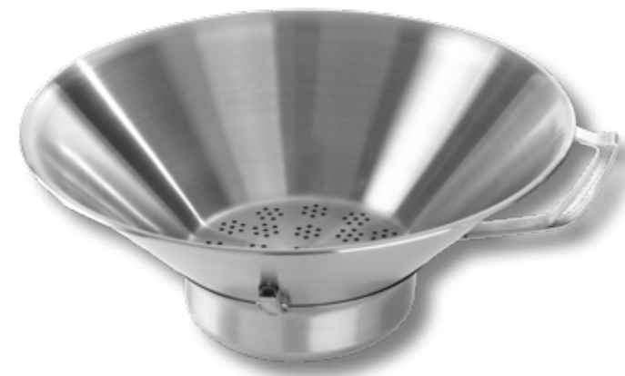
93 FRITOVACÍ SÍTO Z OCELI 630808 průměr 410 x 170 mm, 50 bodů