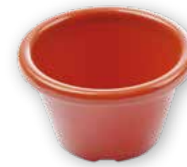
39 MISKA NA OMACKU 565636 terakota, 45 ml, 6 x 6 cm, 15 bodů 12 kusů