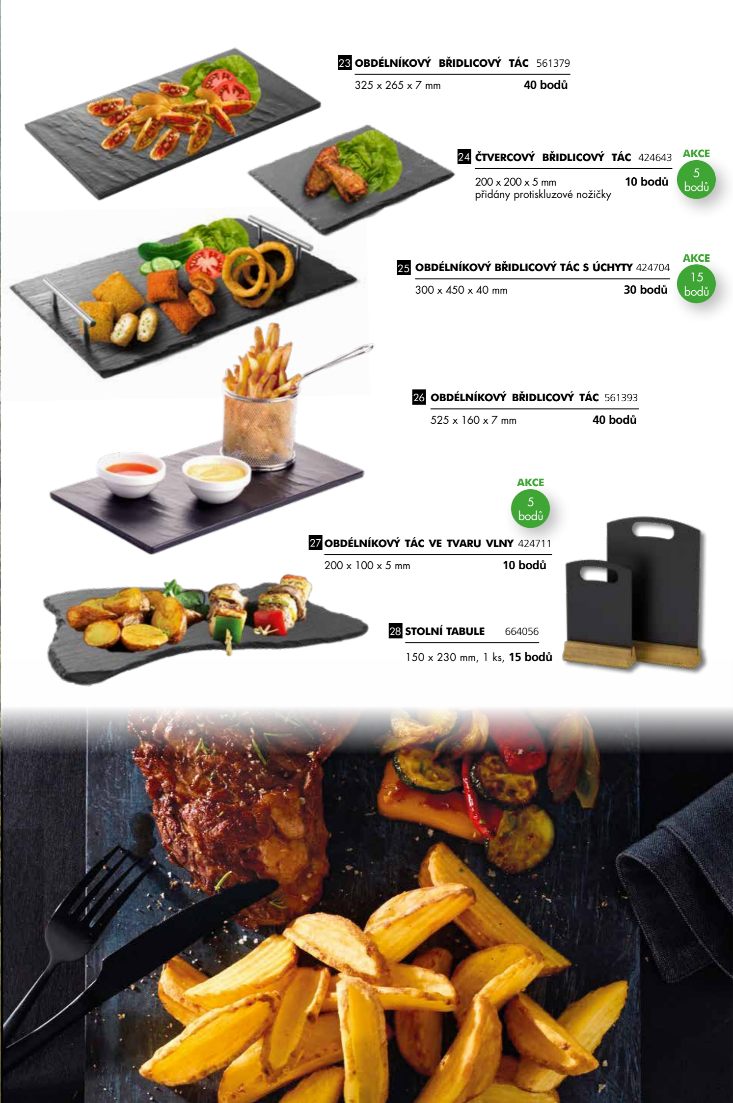
23 OBDELNIKOVY BRIDLICOVY TAC 561379 325 x 265 x 7 mm 40 bodů