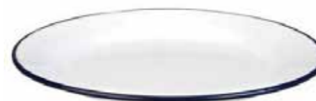
20 MĚLKÝ SMALTOVANÝ TALÍŘ průměr 22 cm 10 bodů