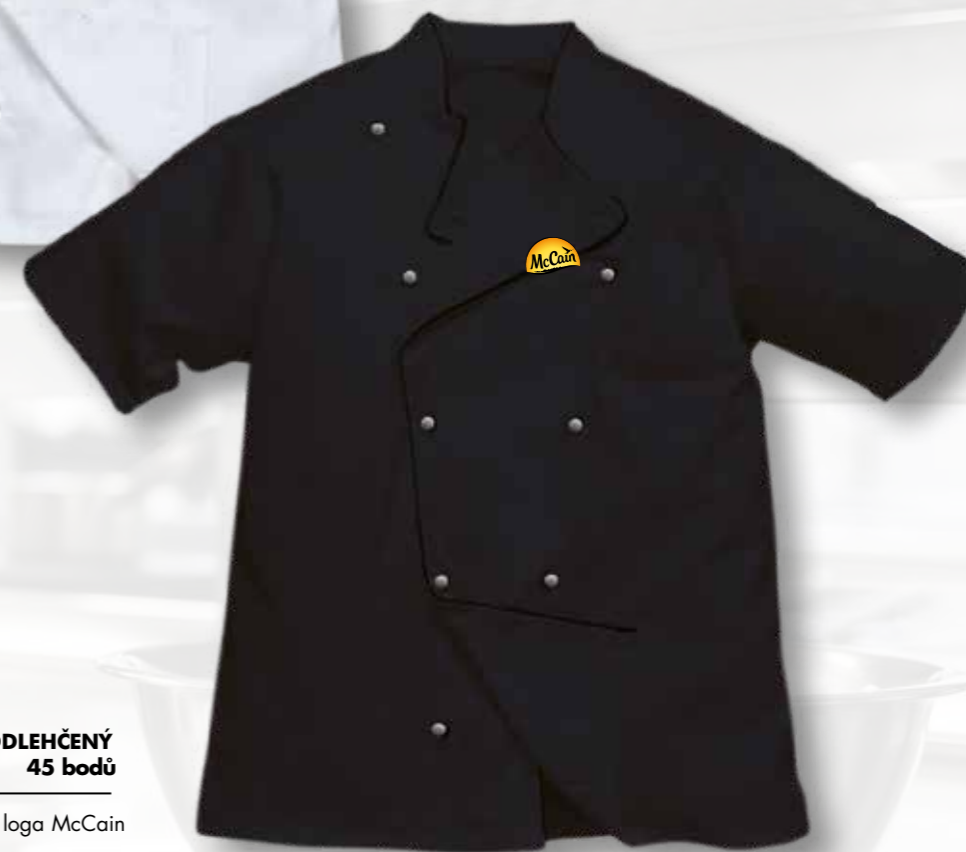
56 ČERNÝ RONDON ODLEHČENÝ KRÁTKÝ RUKÁV 45 bodů