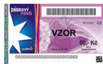
130 POUKÁZKY SODEXO 150 bodů dárkový pass v hodnotě 500 Kč