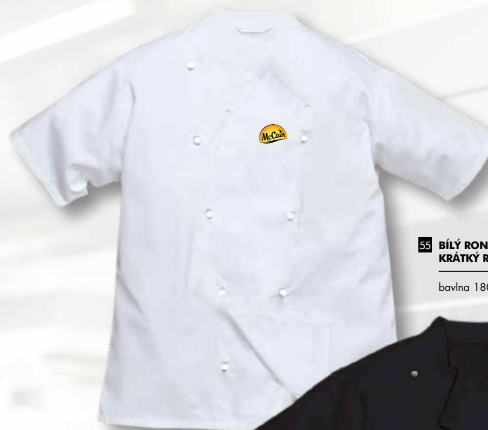
55 BÍLÝ RONDON ODLEHČENÝ KRÁTKÝ RUKÁV 45 bodů

dámský i pánský rondon, bavlna/polyester 195g, včetně loga McCain