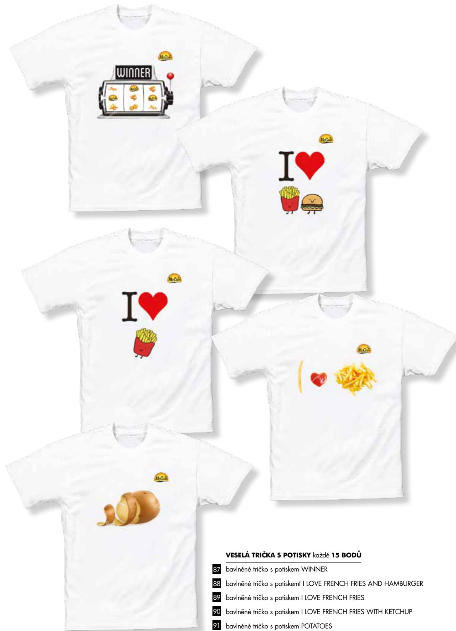
VESELÁ TRIČKA S POTISKY každé 15 BODŮ

vrchní materiál z mikrovlákná, antibakteriální podšívka Cambrelle