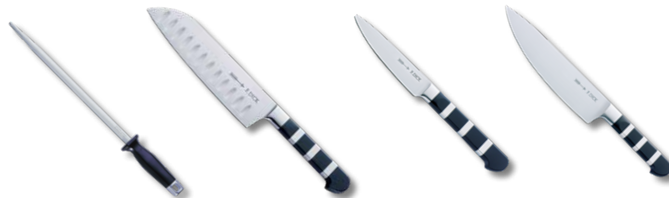
100 OCÍLKA PRO KUCHAŘE