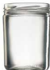
16 SKLENICE „ZAVAŘOVAČKA“ NA HRANOLKY servírovací sklenice, objem 440 ml, 6 ks v balení 10 bodů