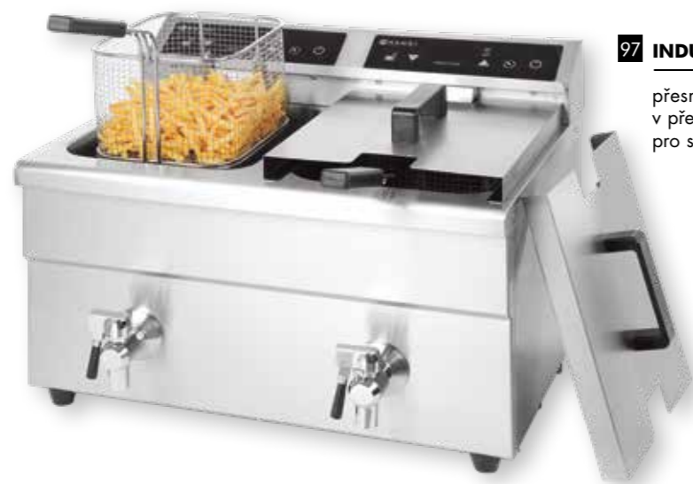
97 INDUKČNÍ FRITÉZA KITCHEN LINE DVOJITÁ 8+8 LITRŮ 215029

přesná kontrola teploty, indukční technologie udržuje olej v přesně nastavené teplotě, dva časové odpočty, tělo z nerezové oceli pro snadné čištění 1300 bodů