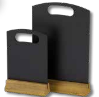
28 STOLNI TABULE 664056 150 x 230 mm, 1 ks, 15 bodů